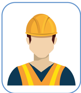
Специалист по ОТ