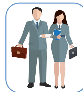
Организации, оказывающие услуги по ОТ